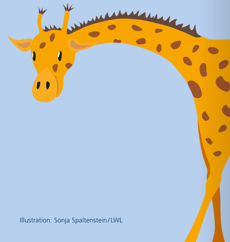
Illustration: Sonja Spaltenstein/LWL

Isabell merkt, dass etwas an der Geschichte, die Mama ihr erzählt, nicht stimmt. Ständig muss sie an Papa denken, was er macht, wo er ist, ob es ihm gut geht, ob er an sie denkt, ob er sie noch lieb hat ... Isabell vermisst ihn. Sie fragt sich, ob sie Schuld daran hat, dass er sich nicht meldet. Sie kann nicht gut schlafen. In der Schule kann sie sich gar nicht mehr richtig konzentrieren. Auch hat sie schon keine Lust mehr, sich mit Freundinnen zu treffen. Lieber wartet sie zu Hause, ob Papa nicht doch noch anruft oder wiederkommt. Mama reagiert auf ihre Fragen komisch. Mittlerweile mag sie schon gar nicht mehr fragen.